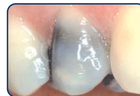
Grijze of zwarte vulling