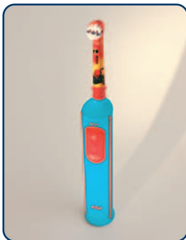
Elektrische tandenborstels voor kinderen hebben een speciale kleine borstelkop

Gebruik een tandenborstel met een kleine borstelkop met zachte haren. Zo komt u overal makkelijk bij. Zodra kinderen een tandenborstel kunnen vasthouden, kunnen ze ook elektrisch poetsen. Er zijn speciale elektrische tandenborstels en opzetborstels voor kinderen. Die zijn kleiner en daarom geschikt voor de kindermond. Poetsen met een elektrische tandenborstel is juist leuk voor kinderen. Het draagt bij aan de motivatie om het gebit goed te verzorgen. Kies een tandpasta met fluoride. Fluoride zorgt voor de